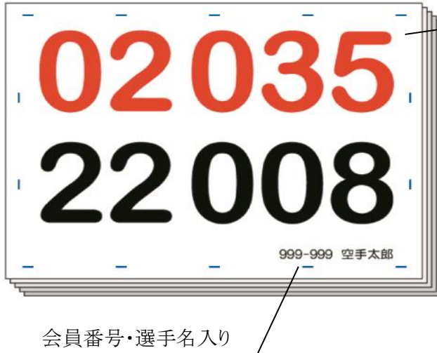
会員番号・選手名入り

兵庫県空手道連盟主催競技大会にて、大会用ゼッケンの斡旋販売を致します。 ゼッケン番号・会員番号・選手名・指定の縫い目の場所を印刷してお届けします。 なお、この斡旋販売は、任意です。別途ゼッケン制作方法に従い各自でお作り頂くことを基本としています。 形・組手の2競技用